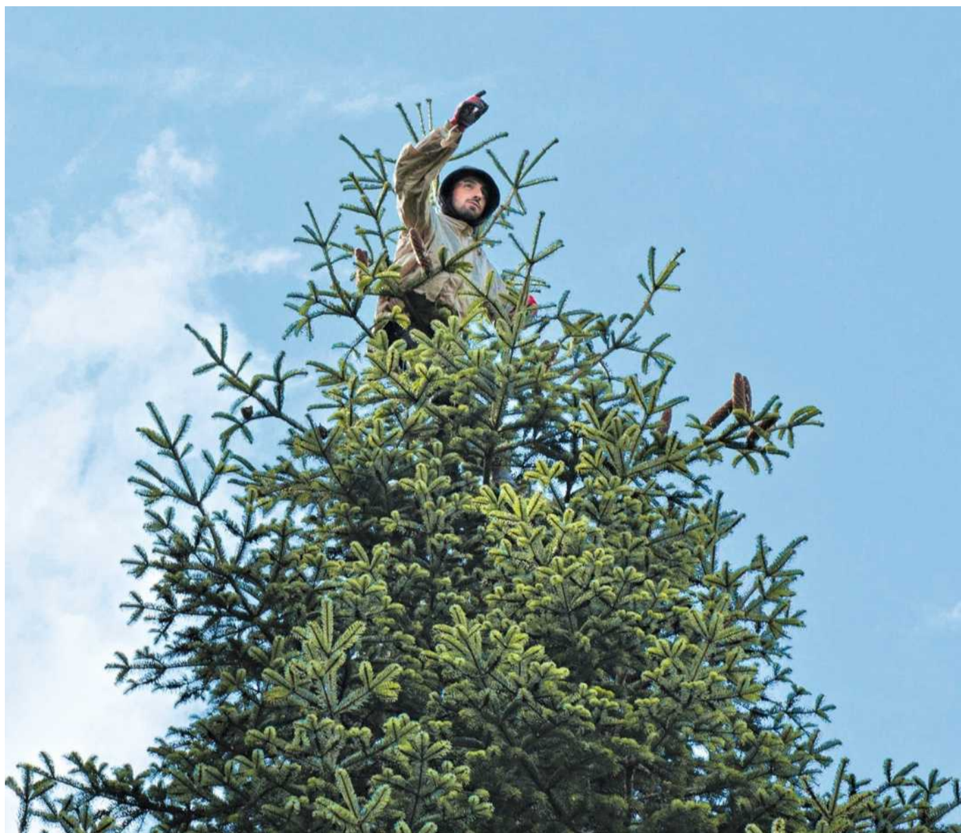
Ein Georgier im Wipfel einer Nordmantanne: Dort wachsen die Samen ...