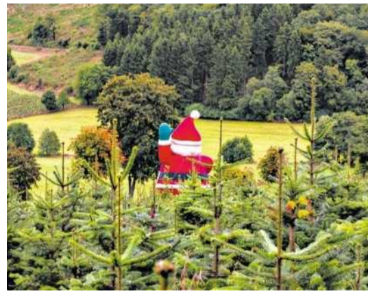
... die ihre Ernte an Weihnachtsbaumplantagen wie diese im Sauerland verkaufen