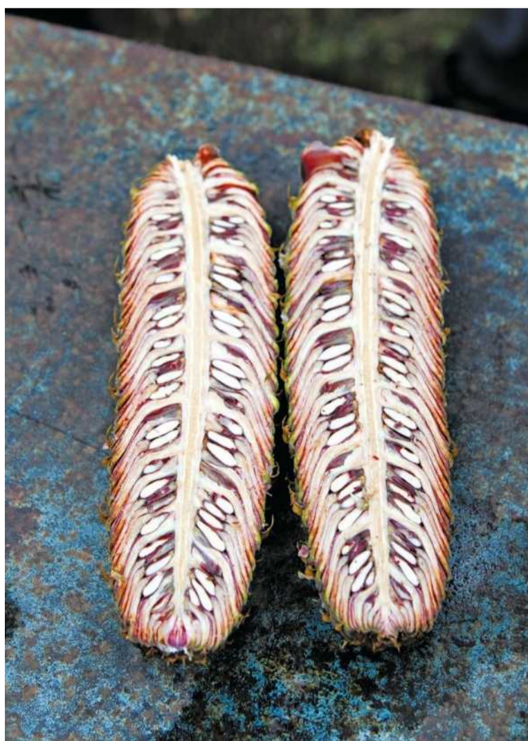
Der Zapfen einer Nordmannantane im Querschnitt, darin die Samen