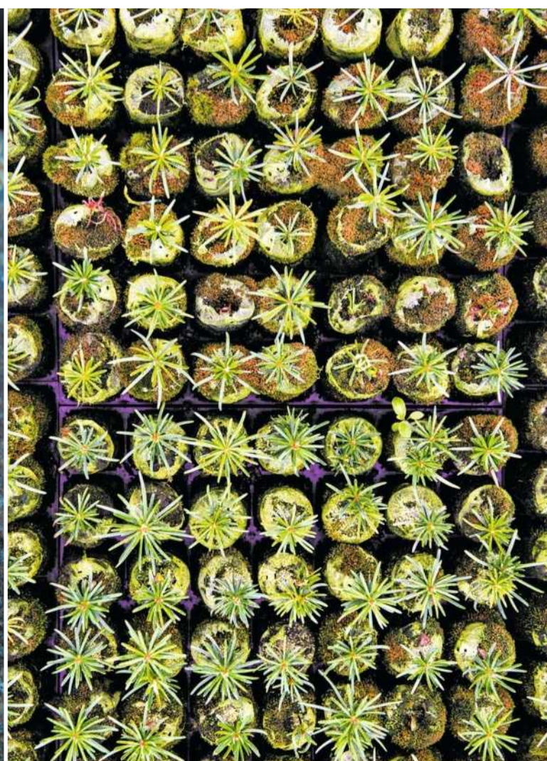
Setzlinge aus Samen der Nordmannantane in einem Gewächshaus im Sauerland