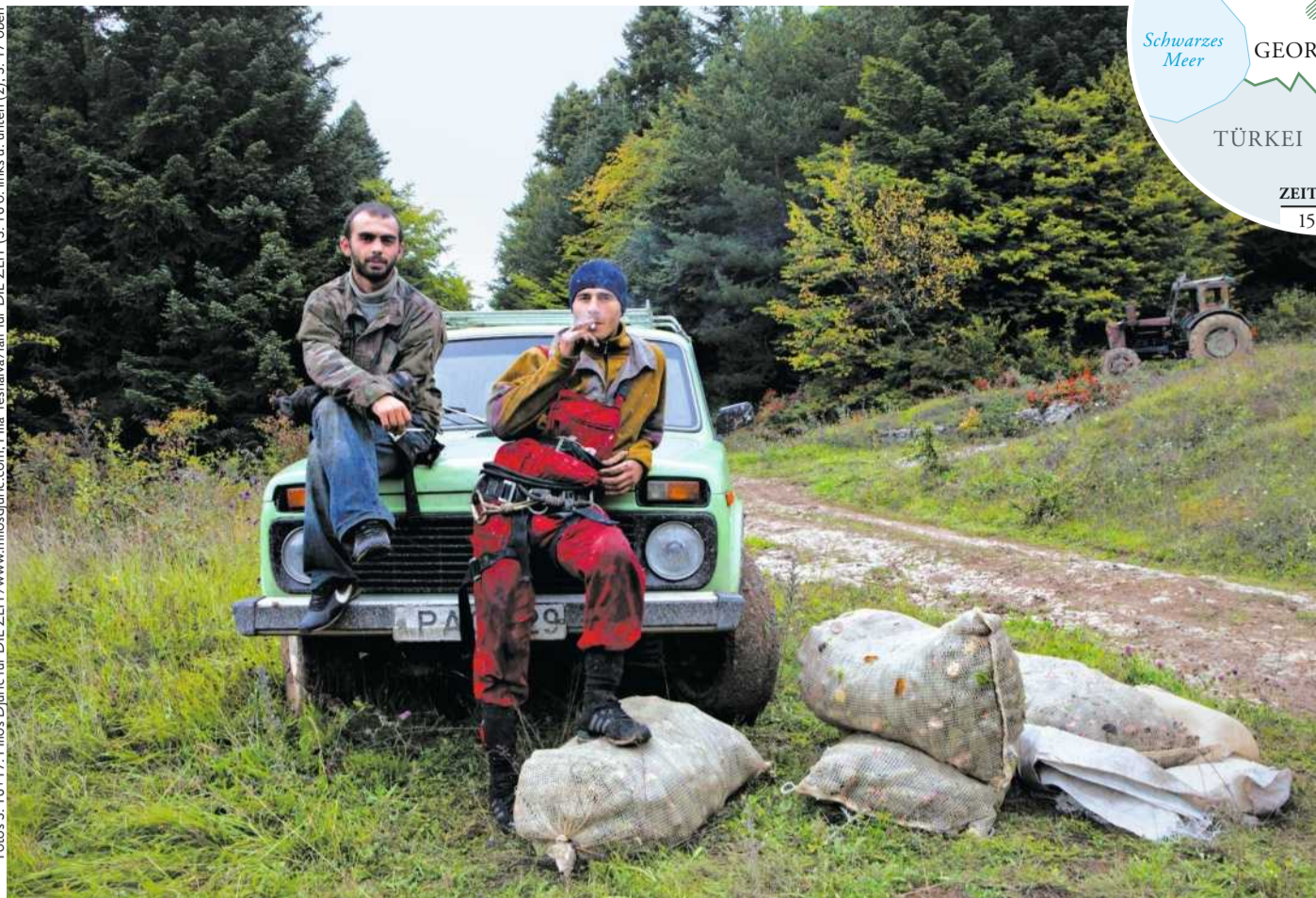
Hin und wieder stehlen Schwarzpflücker wie diese beiden Männer Tannenzapfen ...