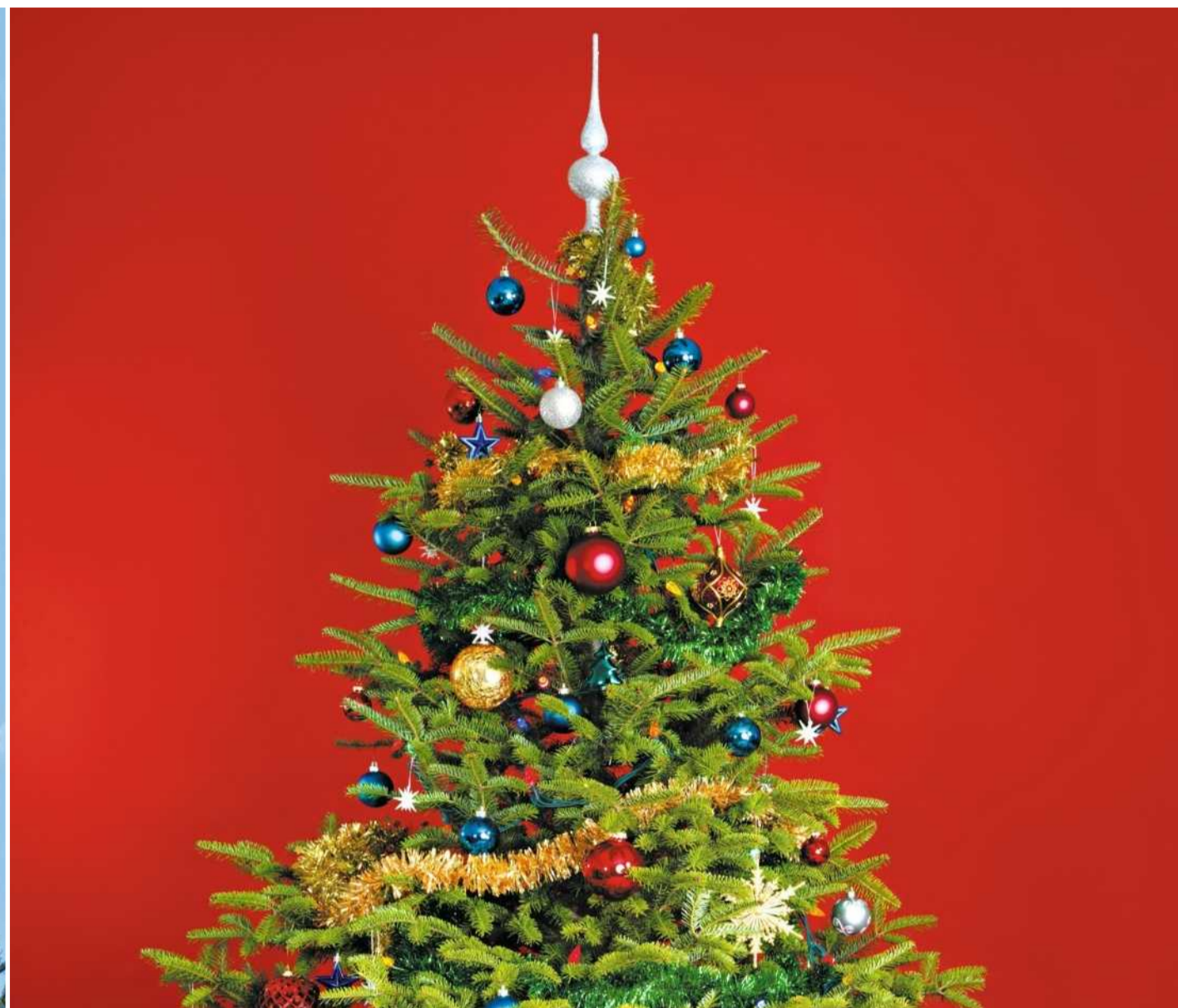
... aus denen später Weihnachtsbäume werden